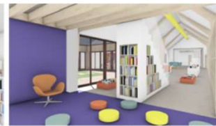
Heure du conte