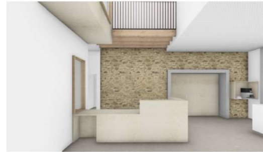
Entrée vers la banque d'accueil