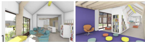
Corridor vers accueil