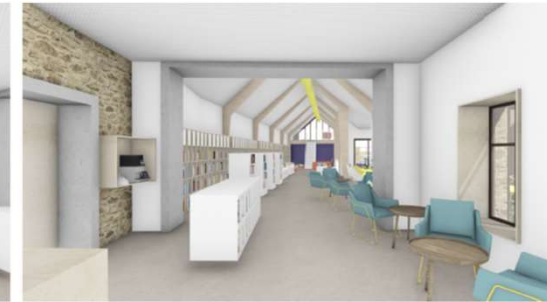
Hall vers espace principal