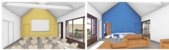
Salles de conférences