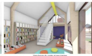
Vers heure du conte et mécanisme