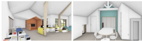
Heure du conte